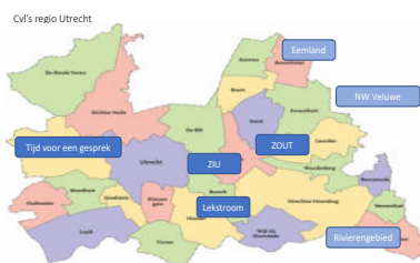
Figuur 3: Centra voor Levensvragen Midden Nederland

Er zijn zeven Centra voor Levensvragen actief binnen de regio Midden Nederland.